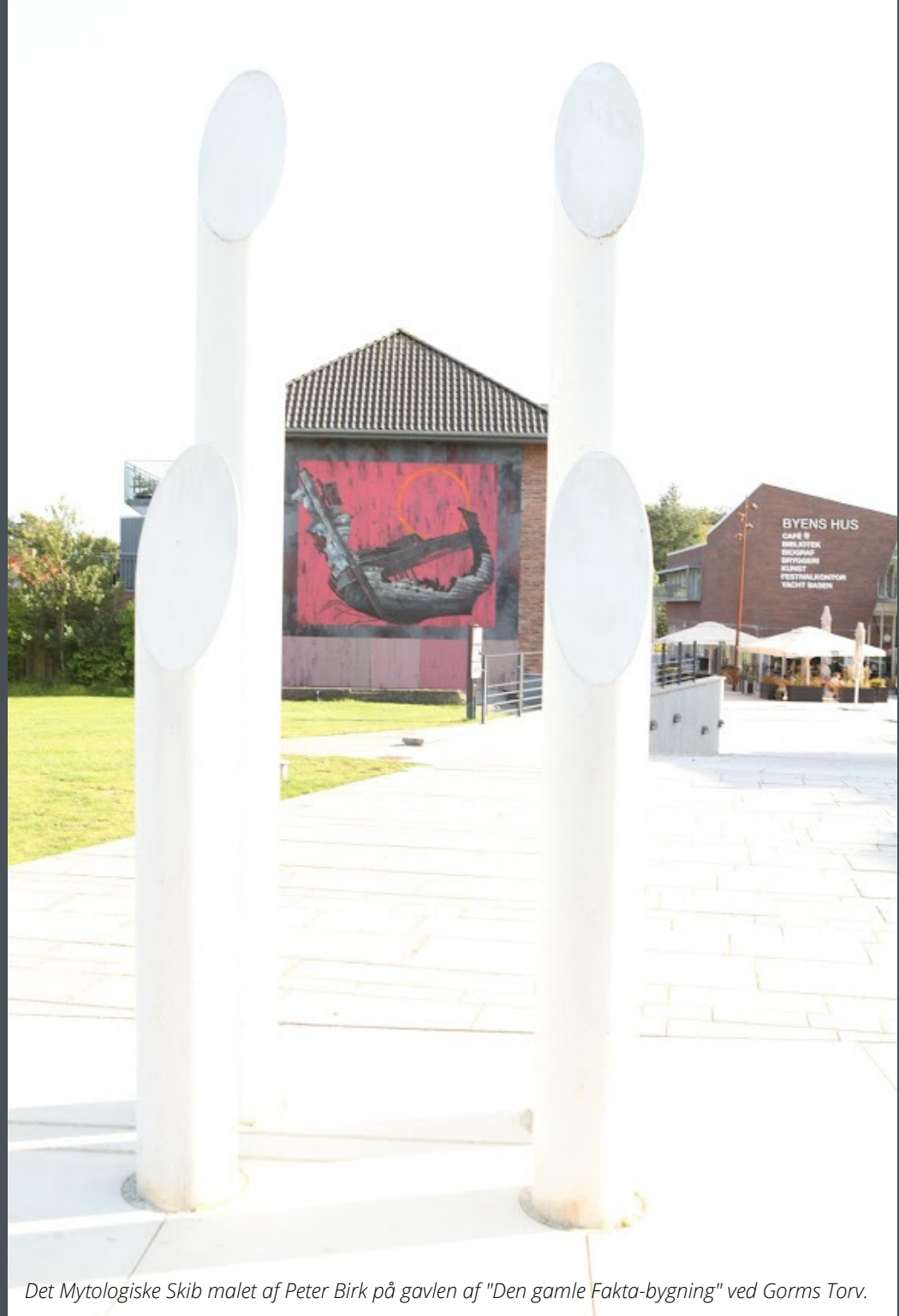
Det Mytologiske Skib malet af Peter Birk på gavlen af "Den gamle Fakta-bygning" ved Gorms Torv.

På sigt tilføjes flere historier og flere placeringer rundt omkring i Jelling. Du kan læse mere om fortællesporet på side 8.